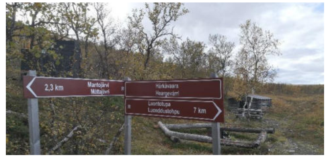
Härkävaarassa on tulentekopaikka.

Toinen lähtöpiste on Utsjoen kirkon vierellä. Utsjoetie 564. Se on maastoviitoihin merkitty nimellä Mantojärvi, koska se on Mantojärven vierellä. Toinen lähtöpiste on Utsjoen kylällä, Miessipolun päässä. Se on merkitty maastoviitoihin nimellä Luontotupa, koska paikalla oli Metsähallituksen luontotupa. Kartoissa tämä on myös info-pisteenä merkitty. Nyt paikalla on vain kartta. Riippumatta siitä, kummasta päästä lähdet kävelemään, alkumatka on ylämäkeä ja lopussa on alamäkeä.