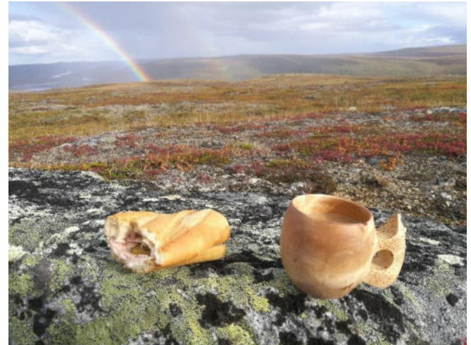
Nauti eväät avotunturissa.