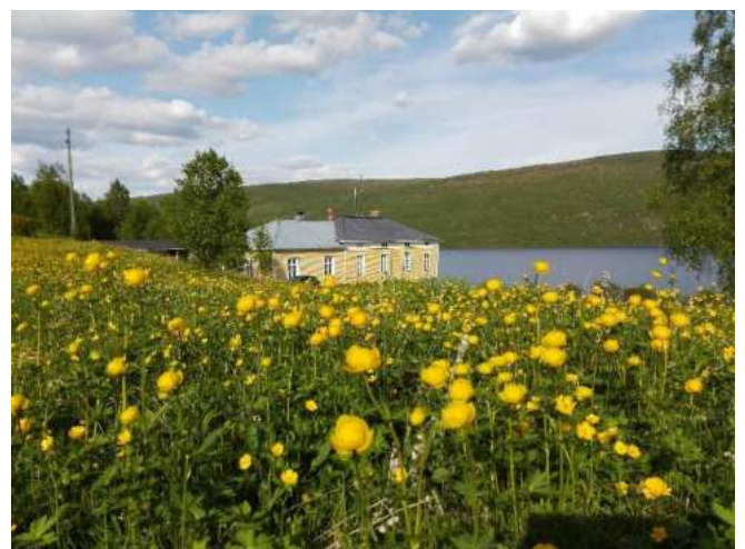
Reitin varrella on opasteita. Ne ovat suomeksi, saameksi ja englanniksi.