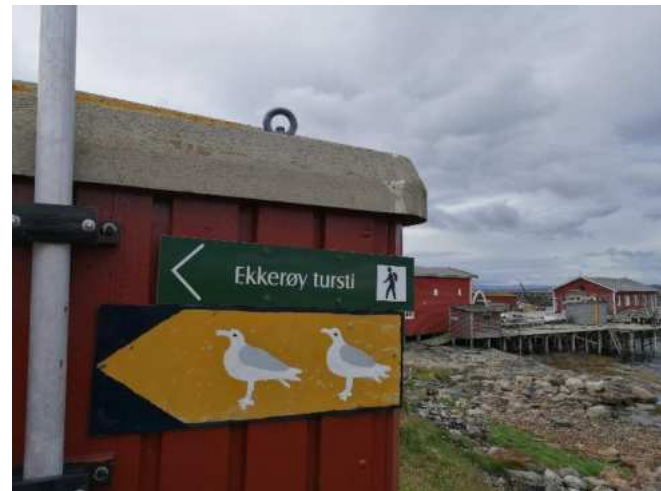
Tämä kyltti ennen satamaa ohjaa patikointireitille.

satamaan saakka, kääntyy vasemmalle ja ajaa noin 200 metriä. Siellä on parkkipaikka. Erityisen hienot näköalat avautuvat vuoren päältä. Ylhäältä voi hilla-aikaan poimia myös hilloja.