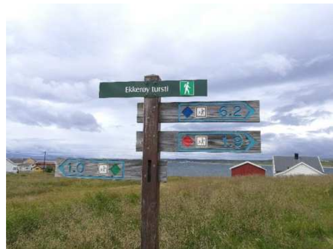
Kävelyreittejä on eri mittaisia.