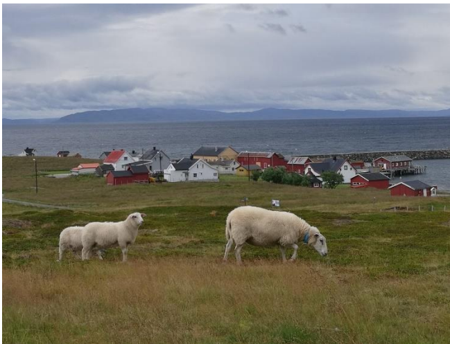
Näkymä patikointireitin alusta

Ensimmäisenä Ekkerøyssä on vastassa hieno hiekkaranta. Hiekkarannalla voi uimisen lisäksi nauttia eväitä, sieltä löytyy muutamia pöytiä. Rannalla on myös WC, joka toimii tarvittaessa pukukoppina.