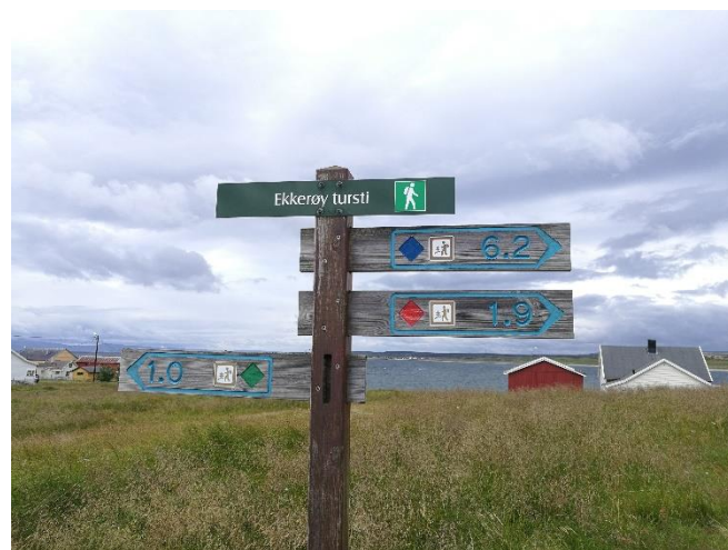
Kävelyreittejä on eri mittaisia.