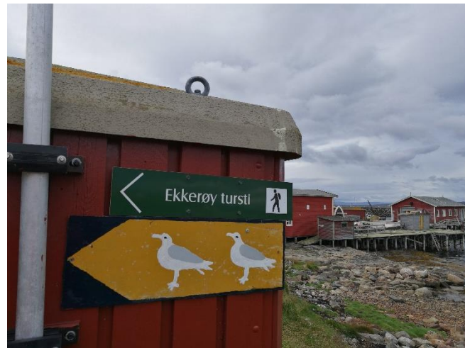
Tämä kyltti ennen satamaa ohjaa patikointireitille.

satamaan saakka, kääntyy vasemmalle ja ajaa noin 200 metriä. Siellä on parkkipaikka. Erityisen hienot näköalat avautuvat vuoren päältä. Ylhäältä voi hilla-aikaan poimia myös hilloja.